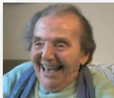
Alice Sommer, pianiste, rescapée de l'holocauste, à l'âge

Et quand arrive la dernière étape, nous pouvons encore servir par notre adhésion à ce qui est. Nous devenons des exemples d'acceptation, de sérénité qui surpassent la souffrance. C'est de cette vieillesse-là dont notre monde a besoin ! Et c'est à cette vieillesse-là que j'aspire.