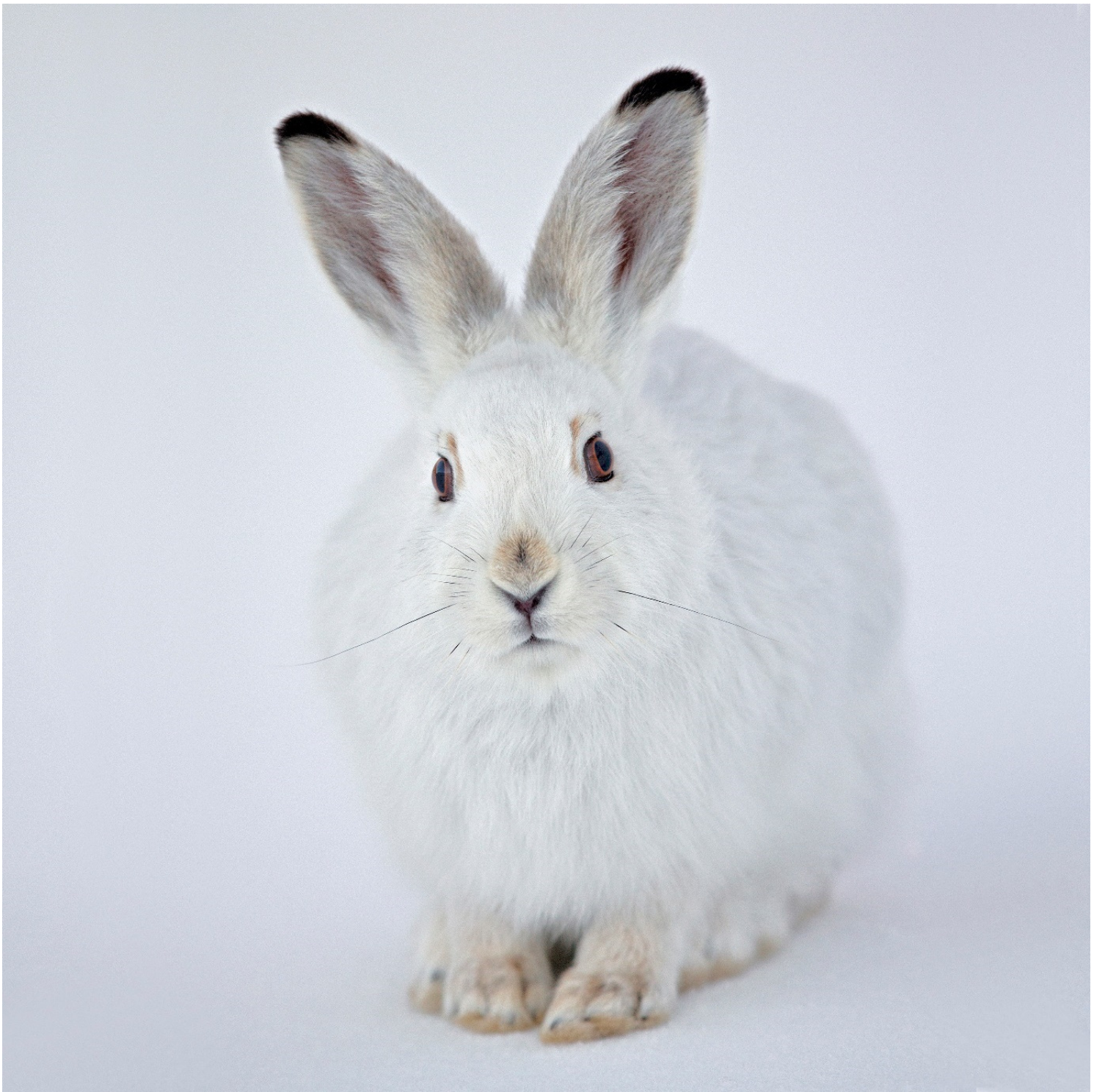
Lapin variable du photographe animalier Olivier Born