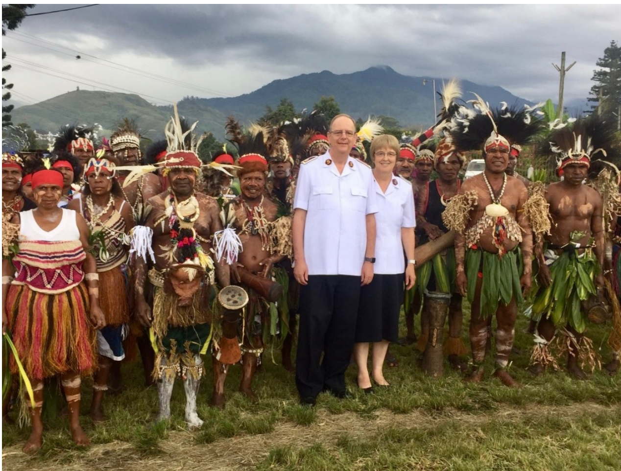
Visite en Papouasie Nouvelle Guinée

Durant ces cinq dernières années nous avons eu le privilège de visiter tous les territoires, commands et régions (62) où l'Armée du Salut travaille et avons ainsi pu voir les différentes facettes et cultures de ce travail. L'Armée du Salut est à l'œuvre dans 131 pays.