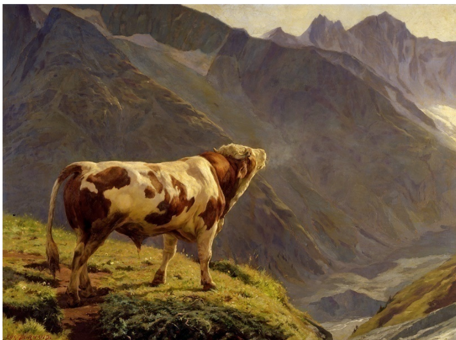
«Le Taureau dans les Alpes» de 1884

Au tournant du XIXe siècle, Burnand est devenu pour les partisans de l'art moderne un contre-modèle, l'exemple même d'un art jugé à tort «photographique». Près d'un siècle plus tard, il est temps de revoir Burnand avec des yeux moins partisans et naïfs.